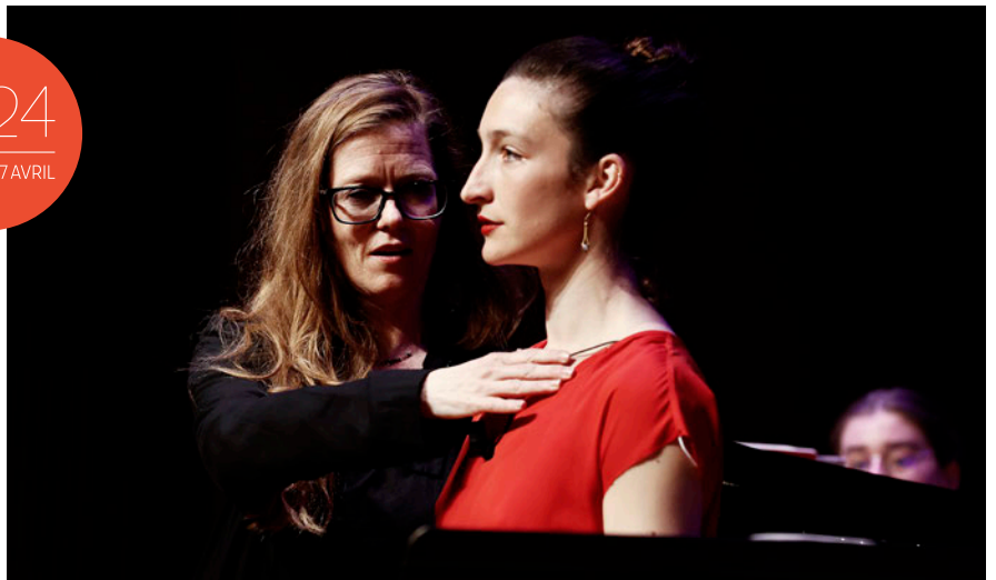
Barbara Hannigan - Master-classe 2022