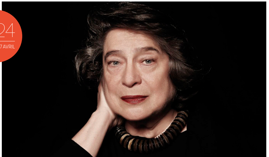
Elisabeth Leonskaja