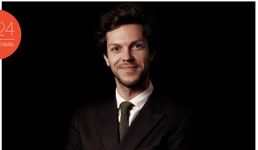
Raphaël Pichon