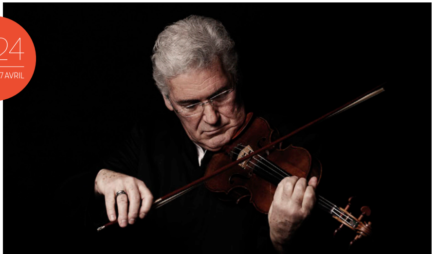
Pinchas Zukerman