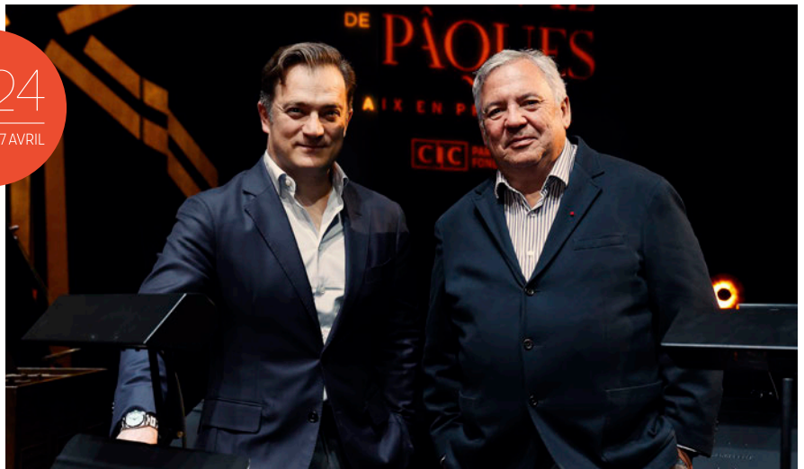
Renaud Capuçon - Dominique Bluzet